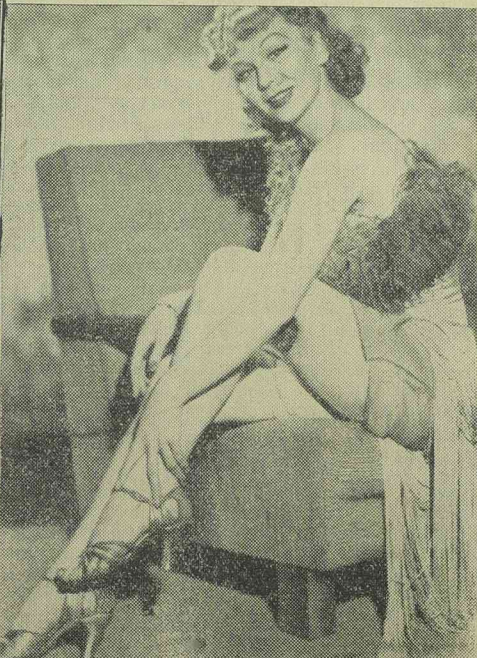
Elfie Gerhardt az UFA egyik legújabb filmjében