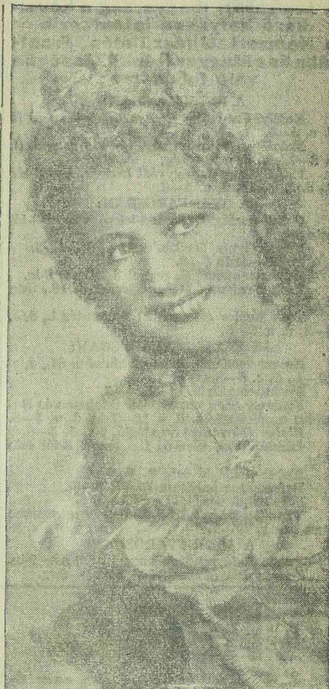
ERNA SACK, a kiváló német énekesnő az UFA „NANON” című filmjének főszerepét kreálta

Egyiptom válogatott—TMAC 2:0 (2:0). Kairóból jelentük: A TMAC csapata tegnap Egyiptom válogatott csapatával mérkőzött és nagy küzdelemben 2:0 arányú vereséget szenvedett. A TMAC teljesítménye a vereség ellenére is kitűnőnek mondható, mert az egyiptomi válogatott csapat igen nagy játékerőt képvisel. A mérkőzésen 8000 főnyi közönség volt jelen.