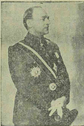
Armand Calinescu belügyminiszter.

Vannak beszédek, amelyeknek időszerűsége nem tart tovább 24 óránál, viszont vannak olyan beszédek is, amelyeknek sokáig széles körben visszhangjuk van. Armand Calinescu belügyminiszter rádióbeszéde a második csoportba sorolható. A belügyminiszter nem sorolt fel esz-