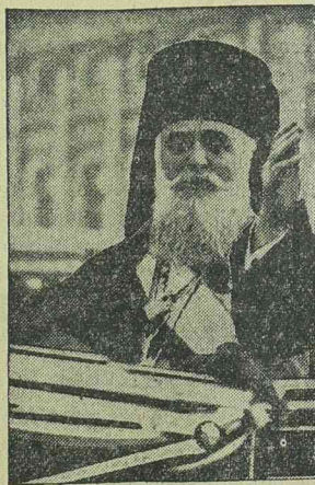
CRISTEA MIRON patriárka-miniszterelnök

Temesvár város lakossága lelkesen készült arra, hogy méltó keretek között, nagy ünnepélyességgel fogadja Cristea Miron patriárka-miniszterelnököt és Calinescu Armand belügyminisztert, akik