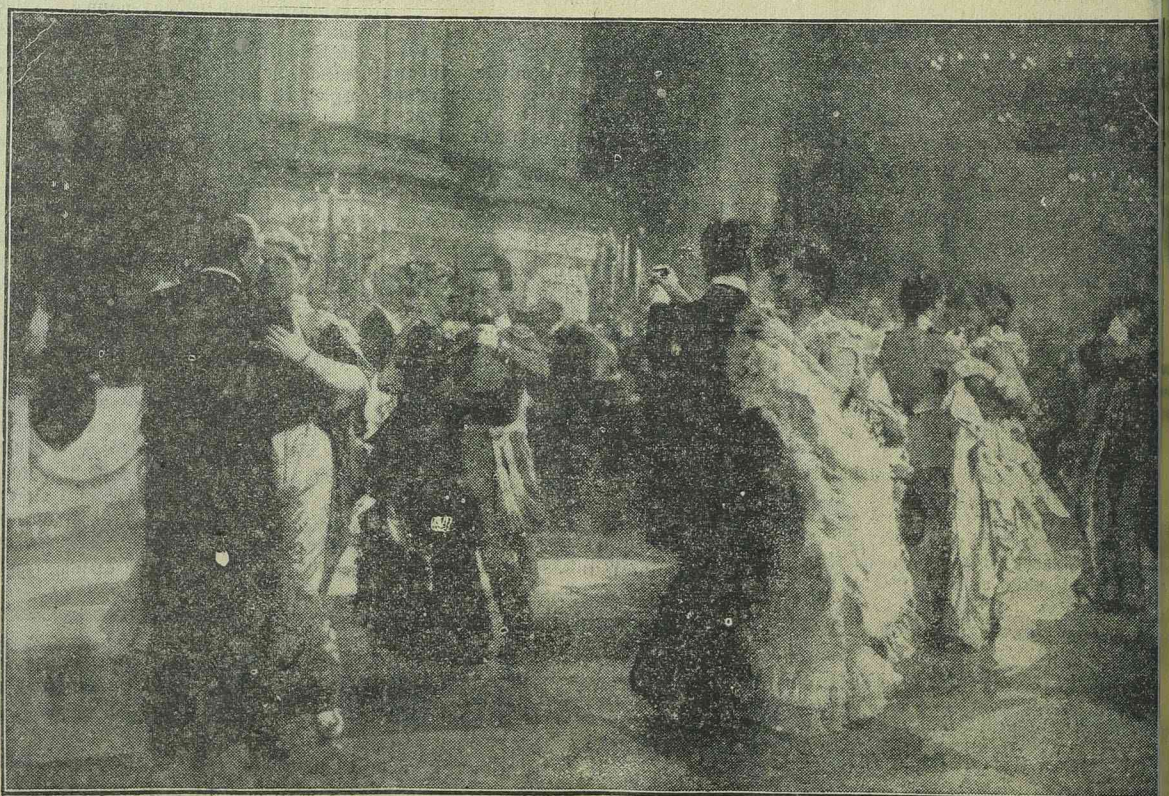
A HAZA című legújabb UFA film egyik pazar jelenetét ábrázolja ez a kép