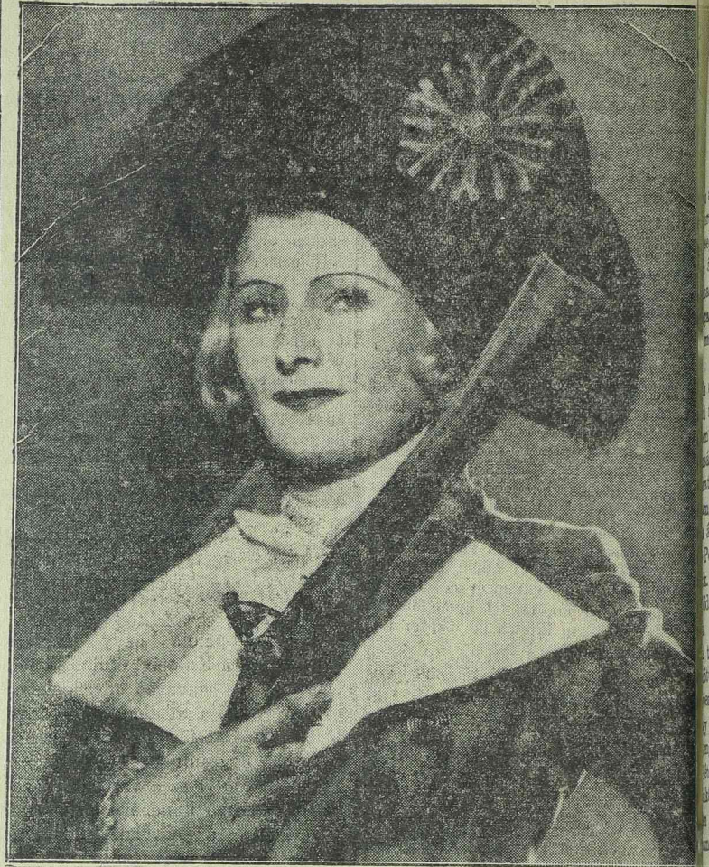
LILIAN HARVEY az UFA filmsztárja a Capricio című filmben

— Eltemették a Balti-megyei tömegmérgezés áldozatait. A Racea községben romlott hussal történt mérgezés halálos áldozatait tegnap nagy részvét mellett temették el. Tegnap érkeztek meg a községbe az egészségügyi miniszterium megbízottai, valamint a törvényszéki orvosok is, akik vegyvizsgálás céljából Bucuresztbe küldik az életben maradt betegek véréit és a megmaradt húsételt.