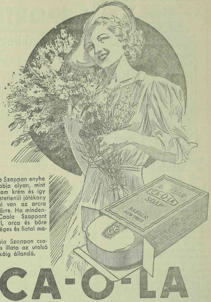
A Caola Szappan enyhe lágy habja olyan, mint egy finom krém és így utalérhetetlenül játékony hatással van az arca és a bőre. Ha minden-nap Caola Szappan használ, arca és bőre egészséges és fiatal ma-rad. A Caola Szappan csodálatos illata az utolsó darabkáig állandó.

— Tömeges kivégzések orosz földön. A lengyel lapok moszkvai jelentése szerint Kiebben ismét kivégzések voltak. Az elmúlt héten Kiebben 217 szovjetkiváltól ítélték halálra és valamennyit kivégezték. A kivégzett szovjetkiváltókat azzal vádolták, hogy ellenforradalmi szervezetekben működtek és trockijista ellenforradalmat akartak Kiebben ki-robbantani.