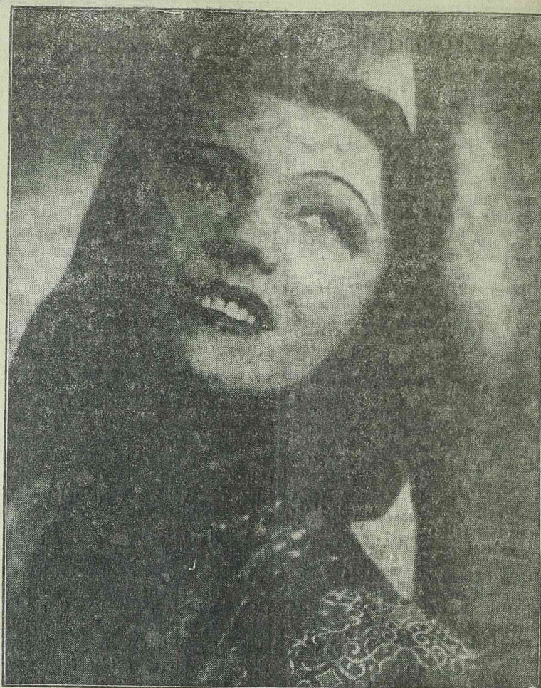
Pola Negri a kiváló filmsztár legújabb szerepében

Az országos betegsegélyező pénztár költségvetése. Az országos betegsegélyező pénztár megállapította költségvetését, amelynek végösszege egy milliárd és kétszázhuszonhét millió leit tesz ki. Ebből 283 milliót a kisipar, 710 milliót a nagyipar fizet be, 223 milliót tesz ki az 1,2 százalékos illeték jövedelme és végül kilenc millió folyik be a betegsegélyzőkönyvek eladásából. Többek között 285 millió leit fordítanak a bucuressi, timisoarai, aradi, azugai, lasiu, erolovai, soloai, toplitsi, sighisoarai, curteadeargesi és bustenii kórházak építésére, illetve kibővítésére.