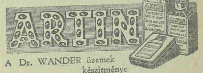
A Dr. WANDER üzemek készítménye

vasuti pályát, ezenkívül elsodort egy fából készült vasuti hidat. A forgalom ezen a szakaszon teljesen szünetel.