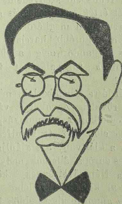
LEON BLUM, francia miniszterelnök