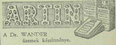
A Dr. WANDER üzemek készítménye.