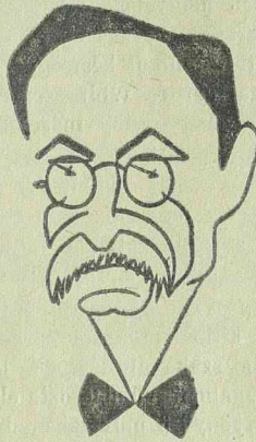
LEON BLUM, az új francia miniszterelnök.

Blum Leon volt francia miniszterelnöknek több napi tárgyalás után vasárnap sikerült megalakítania új kormányát. Arról a szándékáról, hogy a kormányban a kommunistáknak is helyet adjon, a középpártok nyomása folytán lemondott. Az új kormányban huszonhárom minisztere és tizenhét államtitkára van. A miniszterek közül tizenegy szociáldemokrata, kilenc radikális szocialista és három a szocialista unió pártjából került ki. Az új kormány külügyminisztere lett Paul Boncour, aki szintén ezen utóbbi politikai alakulat tagja. Blum Leon a miniszterelnökségén kívül a pénzügyi tárcát is megtartotta magának, Daladier megtartotta a hadügyi, Dormoy pedig a belügyi tárcát. A kormányban többek között helyet foglalnak még Paul Faure, Maurice Violette, Steeg, Albert Sarraut, Vincent Aurioi és Camoigni is. Blum Leon új kormánya esztendőnkön mú-