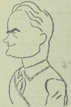
BALDUR V. SCHIRACH

HAZI MUNKÁRA KÉNYSZERITIK A NÉMET LEÁNYOKAT. Baldur von Schirach, a német ifjuság nevelésének legfőbb intézője, rendeletet adott ki, amelynek értelmében minden tízennegy és huszonegy év közötti német leánynak iskolai tanulmányain kívül házi munkaszolgálatot is kell teljesítenie. Ez jelent