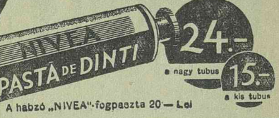
A habzó „NIVEA”-fogpaszta 20 — Lei

most habzó „NIVEA”-fogpasztát is kaphatunk Most vásárolhatunk: habzót vagy nemhabzót vegyünk, bármelyiket megkaphatjuk.