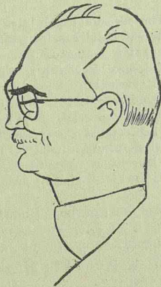
DARÁNYI KÁLMÁN magyar miniszterelnök

vemberben betervezik a felsőház reformjáról szóló törvényjavaslatot, az