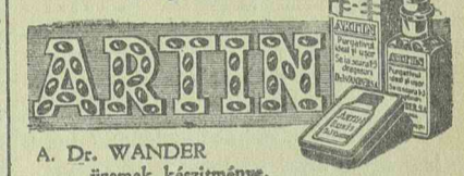
A. Dr. WANDER üzemek készítménye.

ARTIN az aranyérben szenvedők megmentője!