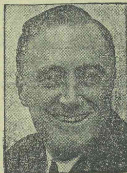
A győzelmes Rooseveltt

Az amerikai választás is megmutatja, hogy a szerelem még a politikai ellentéteknél is erősebb. Rooseveltt egyik legelkeseredettebb ellenfele Dupont hadfelszerelési nagyiparos volt, aki Landon jelöltségét is finanszírozta. Rooseveltt fia régóta szerelmes volt Dupont leányába, akit a választási eredmény nyilvánosságra hozatala után eljegyezt. Az eljegyzés Rooseveltt és Dupont kibékülését hozta maga után.