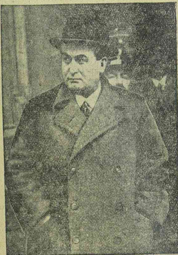
GÖMBÖS GYULA miniszterelnök

Ebből az alkalomból párthívei nagy ünnepeket készítettek rendezni tiszteletére, azonban súlyos betegsége és váratlan halála ezt megakadályozták. Gömbös Gyula vesebajban szenvedett és a megérlelt munkáit folytán szívbajt is szerzett. Hívei már az elmúlt esztendőben gyakran óva intették, hogy kapcsolódjék ki a munkából, azonban az ő temperamentuma és tettekkészsége tudni sem akart pihenésről. Néhány hónap előtt orvosai szigorú utasítására végre elhatározta, hogy szabadságra megy. Ezt a szabadságát Balatonfüreden töltötte az ottani sanatóriumában és áll-