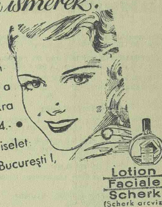
Lotion Faciale Scherk (Scherk arcviz)

amióta feltalálták a Scherk arcvizet, csak le kell mosni vele reggel és este az arcot. A tisztátalan arcok elmúlnak és előtűnik a finom, teljesen tiszta arc. Ár: üvegenként: Lei 62., 103. és 164. • SCHERK Vezérképviselő: «Excelsior» Calea Moșilor, 78 București I.