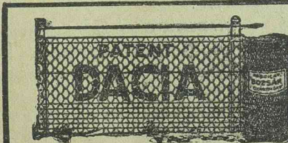
Főközllet: Principele Carol, Bulev. Berthelot 31 (Bejárát Str. Văcărescu Iancu)

- A magyar diákszövetség érdekes beadványa. Budapestről jelentik, hogy a magyar diákszövetség érdekes beadványt intézett a kultuszminiszterhez. A diákszövetség javasolja, hogy a magyar állam létesítsen három ösztöndíjal olyan diákok részére, akik Belgrádban, Bucurestiben és Prágában kívánják tanulmányukat folytatni. Ezzel lehetővé válnék, hogy a magyar diákság megismerne az illető nemzetek életét, valamint annak keretén belül az utódállamokban élő magyar kisebbségek helyzetét.