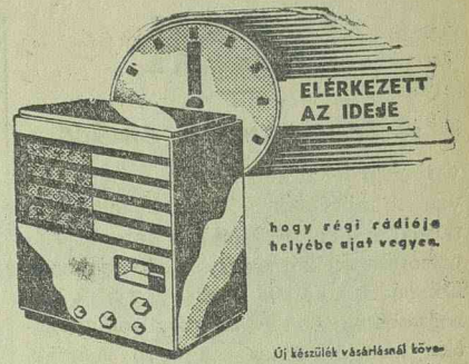
ELÉRKEZETT AZ IDEJE

A fővárosi lapok erdélyi tudósítói szinte egyöntetűen arról számolnak be,