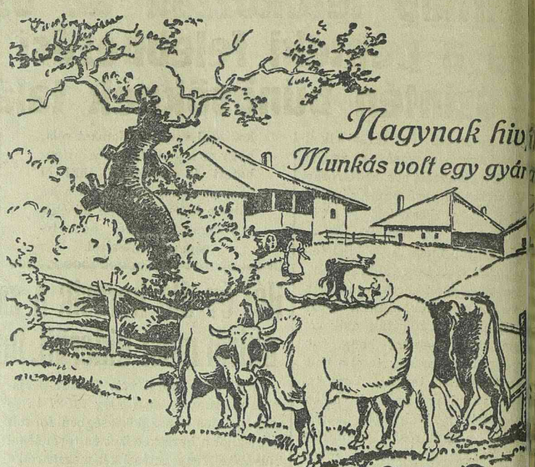
Most szép birtoka van, malma, szántó-földjei és legelője a marhák számára.

TROCKIJ ISMÉT TÖRÖKORSZÁGBA MENT. Párisból jelentik, hogy Sarrault belügyminiszter a minisztertanácsban bejelentette, hogy Trockij elhagyta Franciaország területét és újra Törökországba ment. A barbizoni villában mar csak Trockij titkára maradt vissza, aki a becsomagolást végzi és azután utánautazik Trockijnak és feleségének.