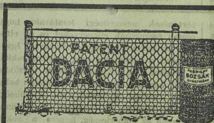
Fióküzlet Józsefváros, Kossuth Lajos-utca 51. (Bejárati Bem-utca)