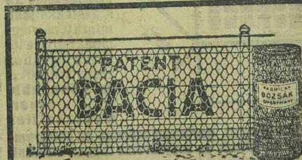
Fióközlet Józsefváros, Kossuth Lajos utca 81. (Bejárati Bem-utca)