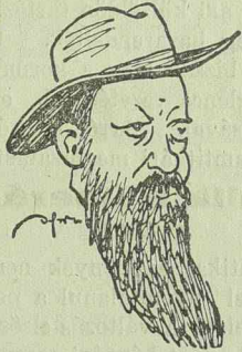
Az új miniszterelnök

Kifejtette, hogy kormánya hiva a polgári szabadságjogoknak és tiszteli a sajtószabadságot. A zsidókérdést a legliberálisabban kezeli.