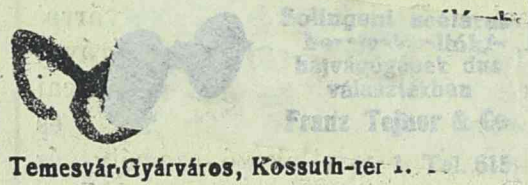
Temesvár-Gyáruvaros, Kossuth-ter. ...