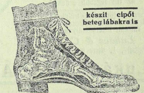
készít cipőt beteg lábakra is

Timisoara, Zápolya-utca 4. (Bejárat a kapu alatt).