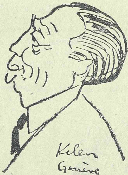
Titulescu londoni követ

nenciában van és hosszas megbeszéléseket folytattak. Lupu dr. a régens tanácsnál történt kihallgatása után felkereste Bratiannu Vintilát és közölte vele, hogy ő a régens tanácsnak koncentrációs kormány megalakítását javasolta Maniu Gyula elnöklete alatt. Egyben pedig