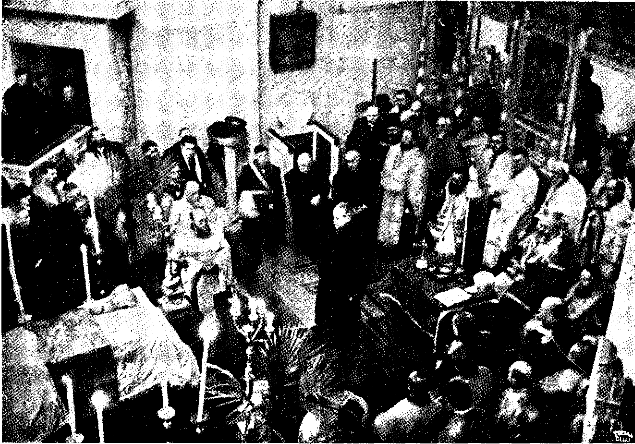
Prohodul din Catedrală.

peste rostul istoric netrecător îndeplinit în viața religioasă și națională, a poporului nostru de dincoace de Carpați. Rezonanța acestor minunate apologii a mișcat până în străfunduri ascunse inimile credincioșilor, făcând să apară profilul duios din sarcofagul aurit în raze de înălțătoare apoteoză românească.