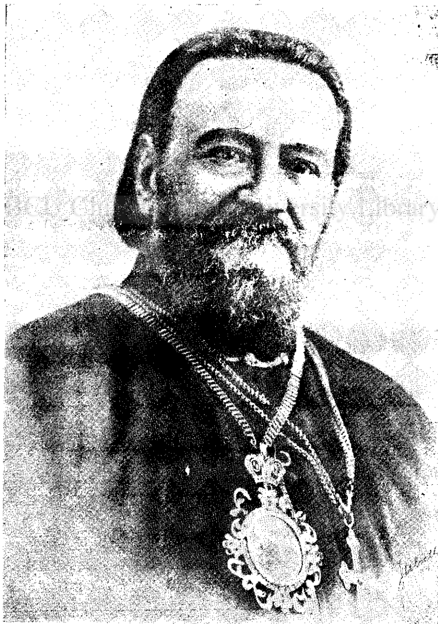
Episcopul Nicolae Avram