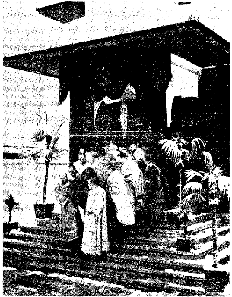
Scoaterea sicriului din biserica Sf. Nicolae.