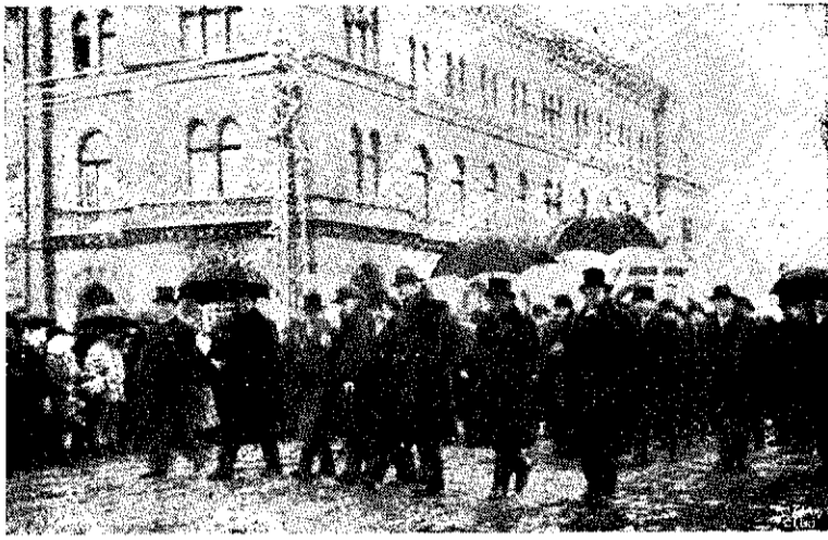
Un grup din cortegiul funerar.