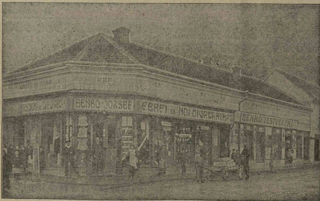
NYOMATOTT A SZÁSZVÁROSI KÖNYVNYOMDA RÉSZVÉNYTÁRSASÁG QYORSSAJTÓJÁN 1916.