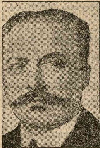
Lebrun, az új köztársasági elnök

kormány lemondását és a tragikusan elhunyt