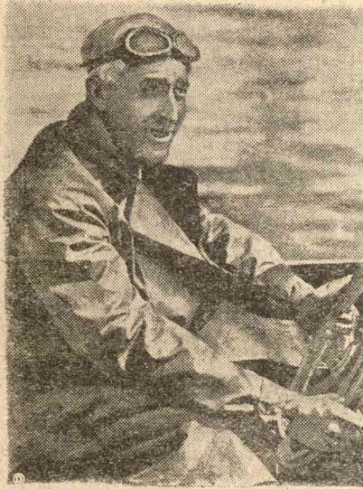
A kínai repülők parancsnoka Sa-Ha-Wan tábornok, Barklay amerikai repülőtisztel azonos. Barklay a világháborúban 20 német repülőgépet lőtt le és rémületben tartja a japán repülő flottát.

(London.) A japánok rövid, de irtószós erejű pergőtűzset bocsátottak ágyuikból Sapeyre,