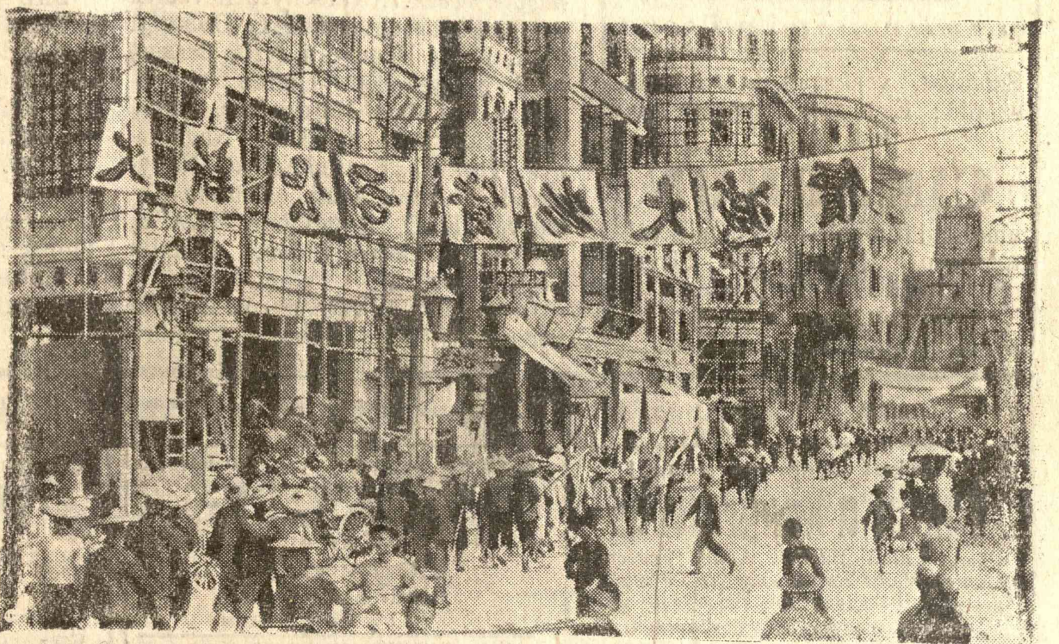
Lapunk mindennap 6 oldal,