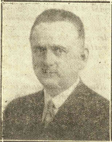
Dr. Pop Valér igazságügyi miniszter

Az elmúlt esztendőben eszméltek végre rá, hogy az erdélyi jajszavak mögött komoly panaszok lappanganak és nem üres siránkozás váltotta ki azokat. Jorga Miklós kormánya látta be először, hogy a beteg Erdélyt orvosolni kell és dr. Pop Valérnak erdélyi miniszterre való kinevezése volt a gyógymód első fázisa. Az új miniszter aki tárca nélkül került be a kormányba és akit a politikusok gunyos mosollyal fogadtak, — hát hogya, amikor hatáskör nélküli miniszter — rövid időn belül megfagyasztotta a kicsinyülő politikusok mosolyát.