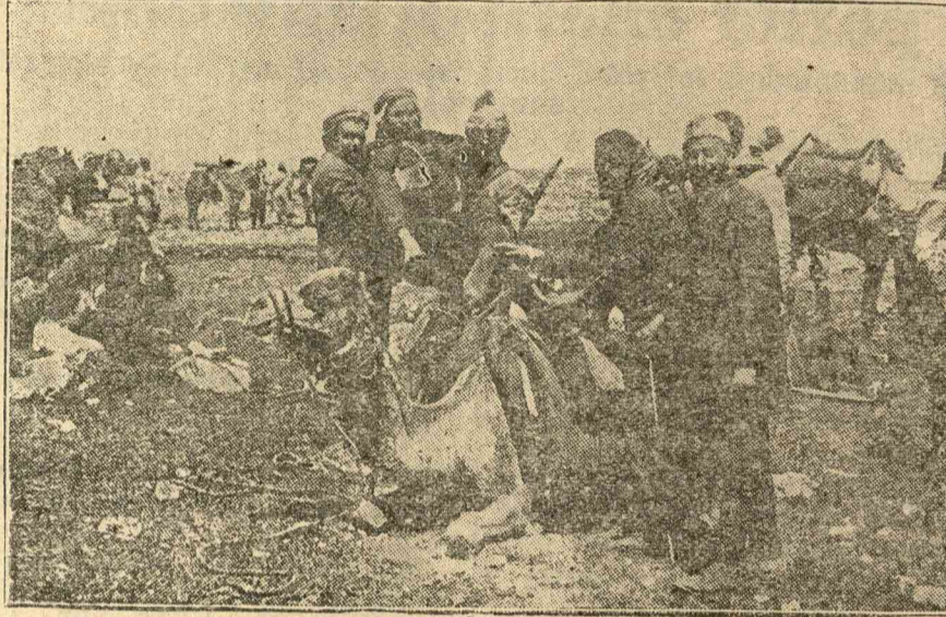
Képünk a wahabita harcias törzsének fiait mutatja, akik a modern idők minden fegyverével felszerelve indulnak a háborúba.

(Jeruzsálem, március 13.) A fanatikus mohamedán Wahabita-törzs hadat üzent Husseinnak, Transjordánia királyának. Amint ők mondják, Irak és Transjordánia népeit az igaz mohamedán hitre akarják téríteni. A hadüzenet igazi oka azonban az a régi ellenségeskedés, amely Ibn Saud király és Hussein király között fennáll.