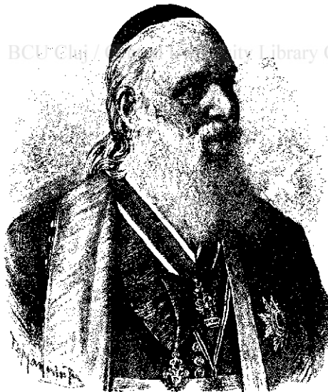
I. P. S. Sa mitropolitul Ioan Mețianu.

Abonamentul: Pe un an 10 coroane; pe o jumătate de an 5 coroane. Pentru România 12 Lei. — Un număr 50 fl.