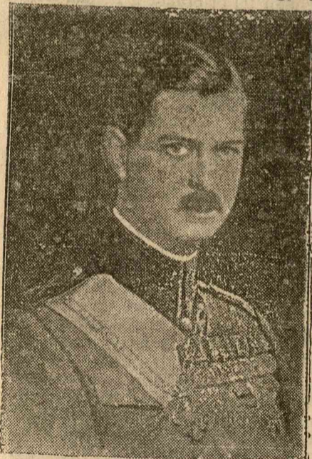
II. KÁROLY KIRÁLY ÖFELSÉGE, Románia új alkotmányának megalkotója, aki bölcs intézkedésekkel fektette le az ország ujjászületésének magasbáivaló alapjait.

Egy év telt el az új alkotmány megszavazása óta, amelyet a legimponánsabb népszavazás hagyott jóvá. A jövő történetírója, aki kutatni fogja mindazokat az eseményeket, amelyek ebben az időben a nemzet életében történtek, a legnagyobb elismeréstől vezéreltetve veszi majd kezébe a tollat és fogja pa-