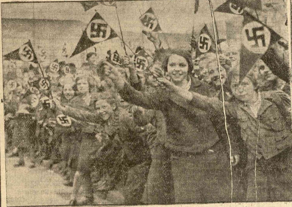
Ujjongó gyermekek roppant tömege a græzaa zoihrtaruy mltellatny nultaromty utvonalon.

En garde, vagyis örök vigyázz-állásban kell így most állaniok szinte az egész világon mindenütt a népeknek, országoknak és azok lakóinak, minden percben számolva a legkellemetlenebb lehetőségekkel is. Hogy hova vezet ez, csak az Isten tudja. Vagy talán a Sátán, aki sohase élvezhette úgy a földkerekség zajlását, mint ma, az antikrisztusok kemény és ádáz korszakában. Mintha lehetne a világ, mehetne az élet sokáig így ebben a felcsigázott idegfeszültségben. Mintha öröm lenne állandó