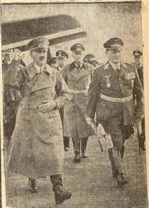
Hitler kancellár megérkezik a tengelyhífi repülőterre. Mellette Göring tábor nagy és mögöttük Keitel tábornok áll.