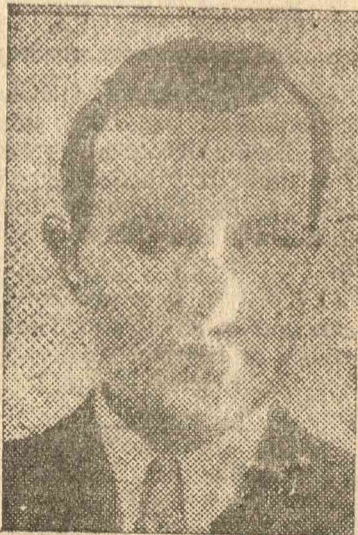
BELIMACHE, a harmadik gyilkos. Szintén életfogytiglan fog rabszolgálni.