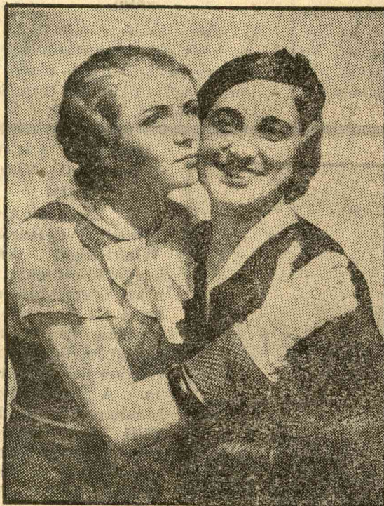
„Miss Európa 1933“ két jelöltje.

ahonnan mindeddig nem sikerült őket felszínre hozni.