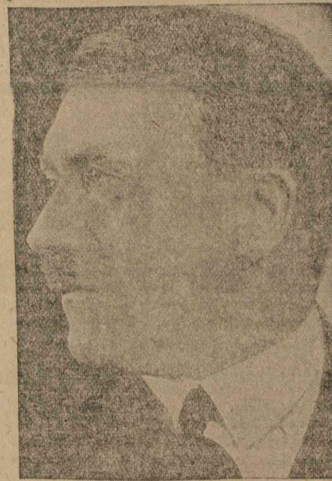
a birodalmi Führer

krónika rettegett főhőse volt. 1924-ben Bukarest egyik leggazdagabb szállodatulajdonosát gyilkolta meg és rabolta ki.