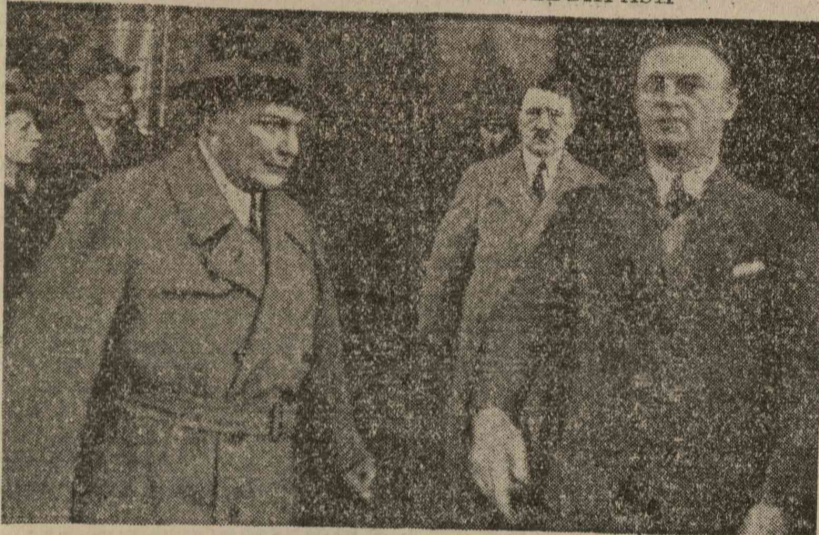
Balról Göring, jobbról Rosenberg

ahelyett, hogy ezt az alkalmat megragadja és a hatalom ormára ült volna. Hitler — ez újból igazolódott — nincs nagy forradalmi lendület, amely becsukott szemmel nekirohan a kínálózó alkalom esérének. A legalitása dominál benne és elhatárolásait megkötik az alkotmányos ideológiák.