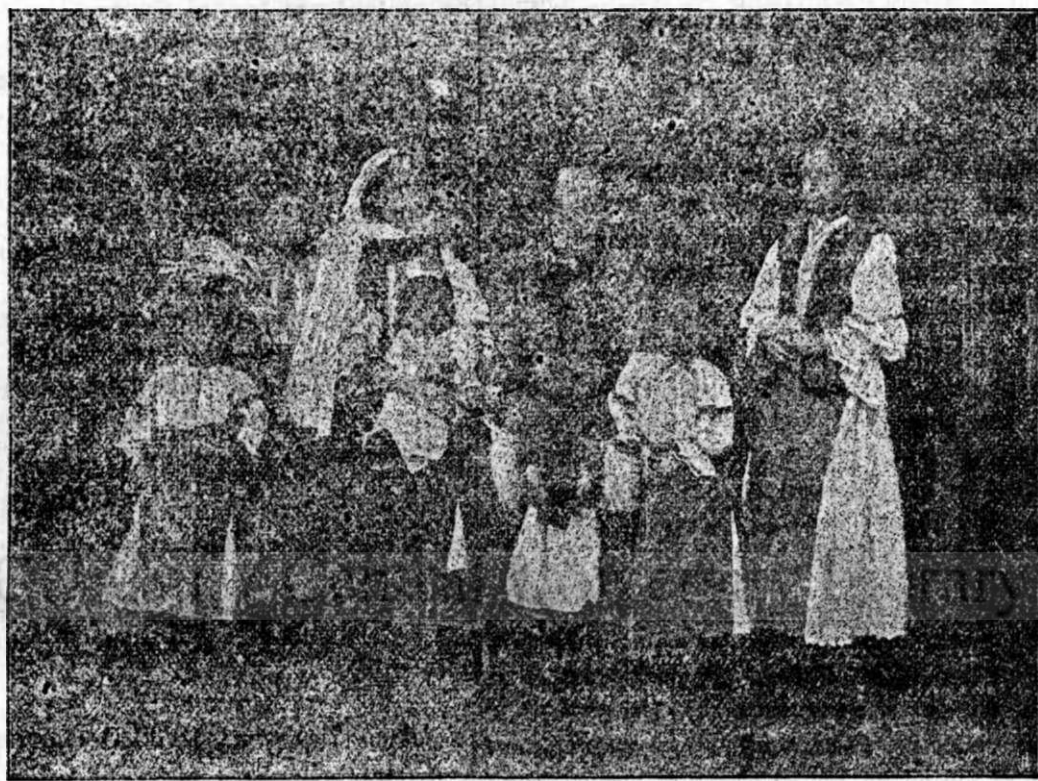
O familie din Bănat.

Convocăm prin această adunarea generală a învețătorilor gr. or. români din Ungaria pe Joi în 28 Octombrie st. n. 1899 în școala gr.-o română din Maerele-Timș rii , pe 9 ore a. m., în scopul modificării statutelor convingutului învețătorilor români, în sensul rezoluțiunii ministeriale de sub Nr. 24.764 și special pentru a dădici sediul convectului.