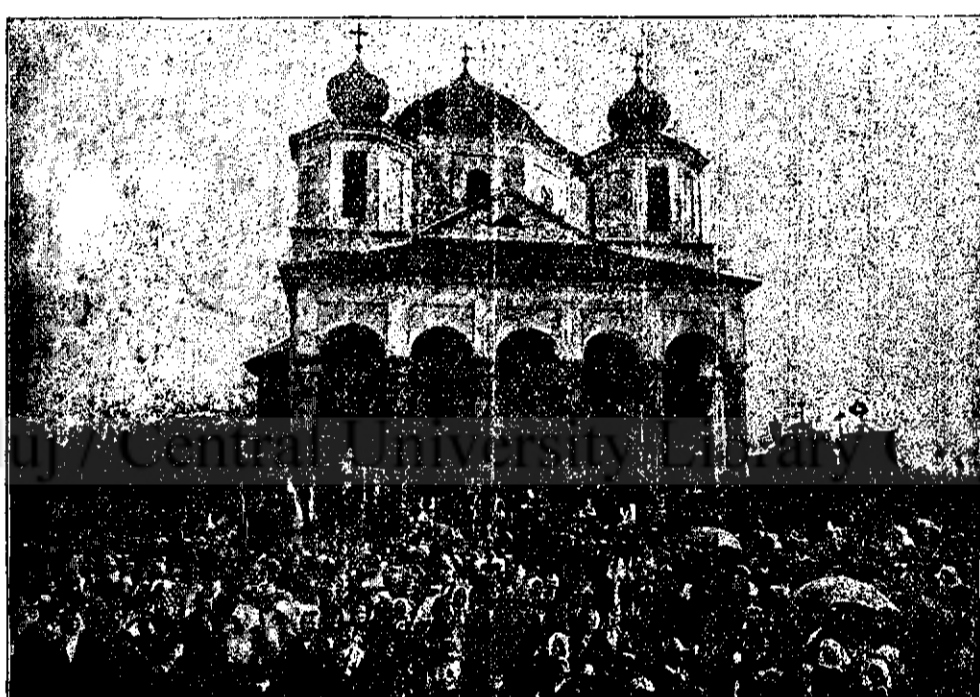
Biserica română gr.-cat. din Șișești.