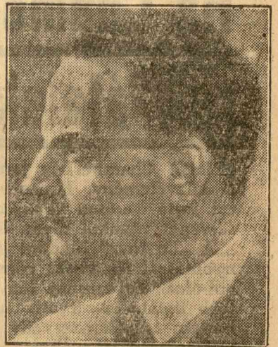
E. Ghelmegeanu közlekedésügyi miniszter

Az elmúlt tíz hónap alatt nem kevesebb, mint 900 millió lei értékű munkát végeztek el utak javítására és csinálására. A mocsvidéken ép úgy, mint Besszarábiában, vagy Máramaros-megyében egyformán serény munkások dolgoztak az annyira fontos utak megjavításán, karbantartásán. Az új utakkal vagy az utaknak teljes rendbe hozásával gazdasági érdekeket védtek, mert olyan területeket kapcsoltak be az ország vérkeringésébe, amelyek eddig éppen a rossz utak miatt