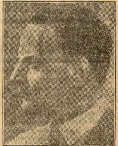
E. Ghelmegeanu közlekedésügyi miniszter

Az elmúlt tíz hónap alatt nem kevesebb, mint 900 millió lei értékű munkát végeztek el utak javítására és csinálására. A mőcvidéken ép úgy, mint Bessarabiában, vagy Máramaros-megyében egyformán serény munkások dolgoztak az annyira fontos utak megjavításán, karbantartásán. Az új utakkal vagy az utaknak teljes rendbe hozásával gazdasági érdekeket védtek, mert olyan területeket kapcsoltak be az ország vérkeringésébe, amelyek eddig éppen a rossz utak miatt