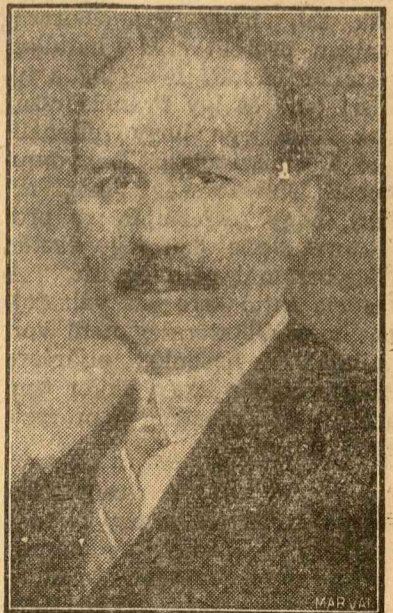
Ionescu-Sisesti földművelésügyi miniszter

Ionescu Sisesti földművelésügyi miniszter a munka dandárját végezte el ebben a tíz hónapban. A legfontosabb: a parasztság életnívójának emelése, amelyet csak úgy lehet elérni, ha a mezőgazdasági