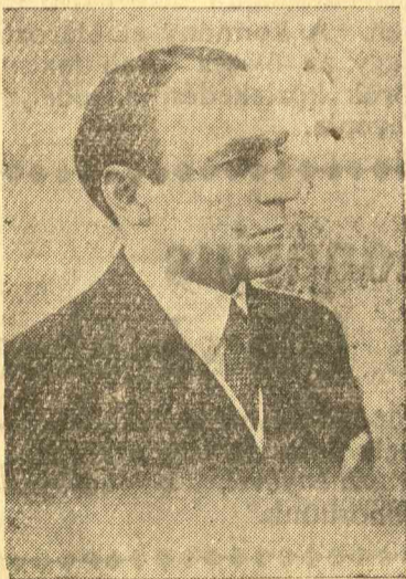
Armand Calinescu belügyminiszter

Armand Calinescu belügyminiszter első és legfontosabb cselekedete volt a belső rend, a nyugalom helyreállítása és ez az egész vonalon sikerült is. A politikamentességbe való zökkenő nélküli átvezetés az energikus belügyminiszter ér-