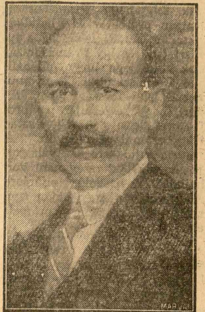
Ionescu-Sisesti földművelésügyi miniszter

Ionescu Sisesti földművelésügyi miniszter a munka dandárját végezte el ebben a tíz hónapban. A legfontosabb: a parasztság életnivójának emelése, amelyet csak úgy lehet elérni, ha a mezőgazdasági