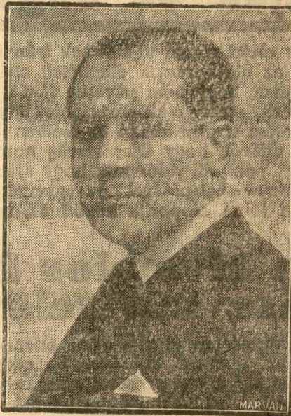
Mitita Constantinescu nemzetgazdasági miniszter

met, természetesen szigorúan szem előtt tartva a román elem támogatására alkotott törvényt. Az elmúlt év tíz hónapjában a minisztérium kebelében működő ellenőrző bizottság 816 céget büntetett meg 4.533.400 lei erejéig, mert