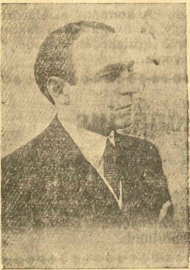
Armand Calinescu belügyminiszter

Armand Calinescu belügyminiszter első és legfontosabb cselekedete volt a belső rend, a nyugalom helyreállítása és ez az egész vonalon sikerült is. A politikamentességbe való zökkenő nélküli átvezetés az energikus belügyminiszter ér-