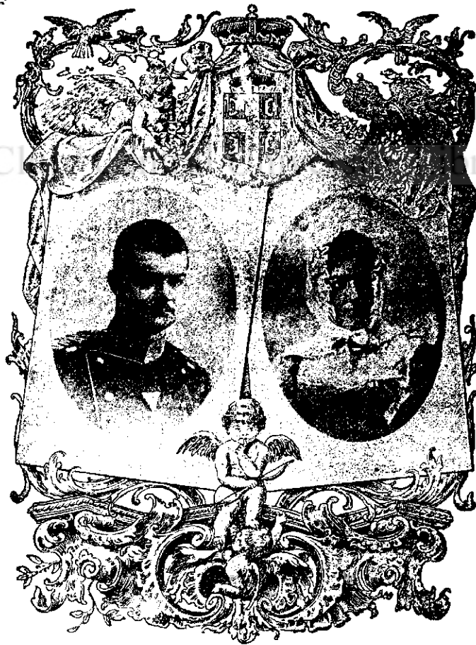
Regele Sârbiei Alexandru I. și Regina Draga.

O schimbare parțială înspre bine s'a întemplat prin înființarea celor 6 regimente de graniță. Imensei maiorități a populațiunii rurale iobăgite i-s'a dat astfel ocaziune de a vedea diferența între iobăgie și serviciul populațiunii militarizate. De aceea mulțime de iobagi cereau să li-se dea arme și să fie așezați pe moșiile granițarești. Amară a fost însă și soarta granițarilor, sub o disciplină severă, în servicii și lupte îndelungate și grele, așa că economia în cea mai mare parte trebuia să o poarte femeile. Grea peste tot a fost vieața țeranului român și în Săsime, unde aveau să plătească zecime preoților săsești și alte