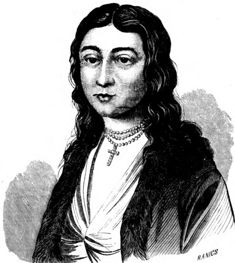
Dómn'a Flórea soci'a lui Mihaiu Eroulu.

Fractatele be- trane, capitulatiu- nile onorifice ale Moldo-Romaniei, eluptate mainain- te cu parate de sange, si apoi in- cheiate cu sulta- nii: Bajazetu, Ma- homedu alu II, Selimu I, si Soli- manu II, acum cu iesítulu seclului alu XVI, se fecera numai batjocura in ochii pagani- loru turci; asié pentru câ au mor- ritu de multu Mir- cea, Stefanu, Vla- descii, Ionu, toti atátia genii vin- decatori ai liber- tátioru poporului romant; éra apoi tiranii numai pa- na atunci ti-res- pectéza drepturi-