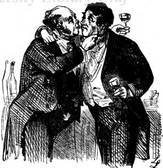
Dupa alu cincile pocalu.

Deslegarea gâcituri de siacu din nr. 27 :