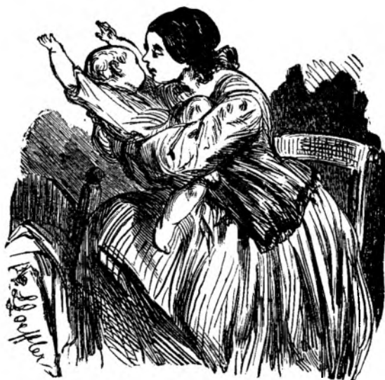
Nani nani puisioru!