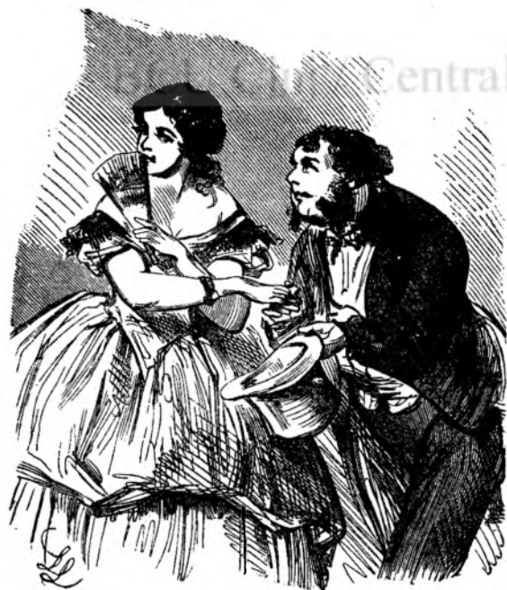
Sarutarea de mila.