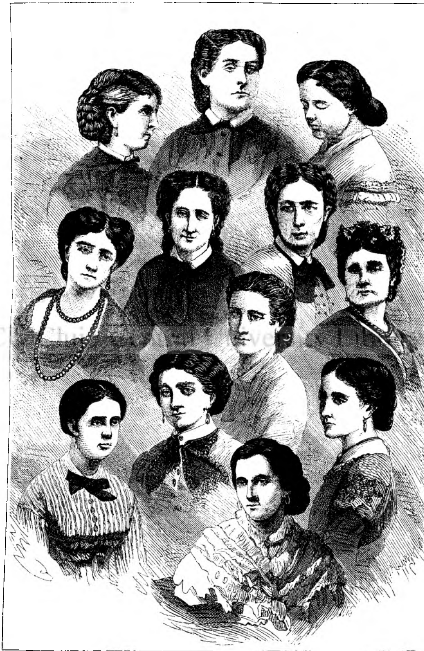
Princes'a Cristin'a Bonaparte. Princes'a Ana Murat. Soci'a gen. Mac Mahon. Marquise-a Gallifet. Imperat s'a Eugeni'a. Princes'a Metternich. Princes'a Matild'a. D mn'a Carette. Princes'a Clotild'a. Contes'a Walewsca. Soci'a gen. Canrobert. Contes'a Pourtales.

Astu-feliu sê atîtiã betranulu;  r' Sinovi'a se parea c  singura er  convinsă, c  pr  curundu si-a desfasuratu nevointi'a, tacea ca mută, fara nici o lacrimă, — ea care se pregătise la ac sta scenă demultu.