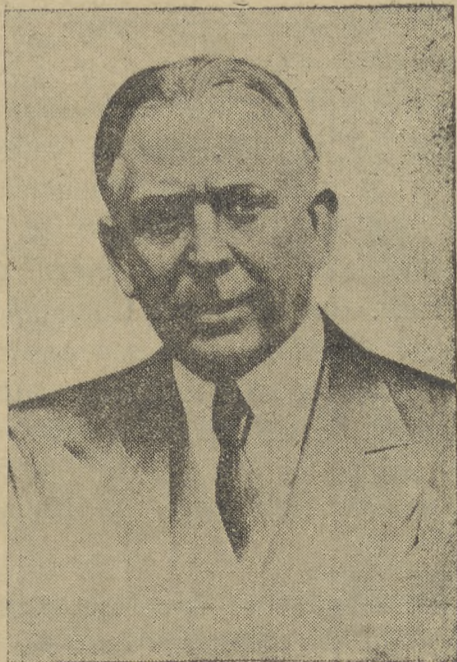
DI OCTAVIAN GOGA Președintele Partidului N. C.