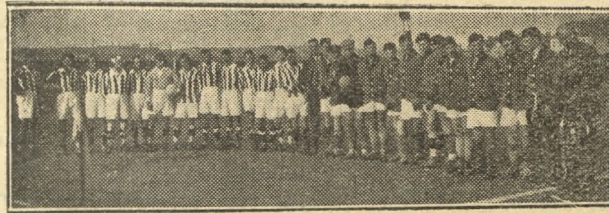
Intern. Taubstummen-Fussballmatch Prag—Lyon 5 : 0.

Prag. — Grindung einer Zentralberatungsstelle. Wie wir der „Svepomoc Neslyšicich“, (Zeitung der czechischen Schicksalsgenossen,) entnehmen, wurde in Prag der Verein: „Ustředni poradna pro hluchoněmé v. čs. R.“ (U. P. H.) gegründet. Dieser Verein hat zum Zweck die Wahrung der Interessen der Taubstummen in Czechoslowakei und besteht aus folgenden Abteilungen: 1. Evidenz und Statistik, 2. Soziale Angelegenheiten, 3. Gewerbe und Handel, 4. Gesundheit, 5. Organisation, 6. Rechtsangelegenheiten. Corespondenz czechisch. Auf Wunsch wird auch in französischer und deutscher Sprache beantwortet.